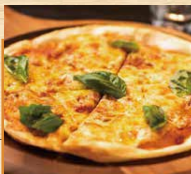
■ マルゲリータ クリスピーピッツァ ¥1,400