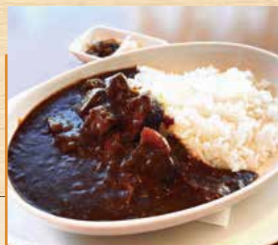
■ ニューオータニ 特製ビーフカレー ¥1,700