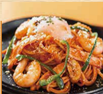
■ 昔ながらのナポリタン 鉄板焼き 温泉玉子添え ¥1,700