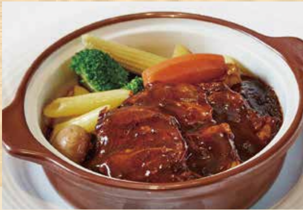
ビーフシチュー 温野菜添え