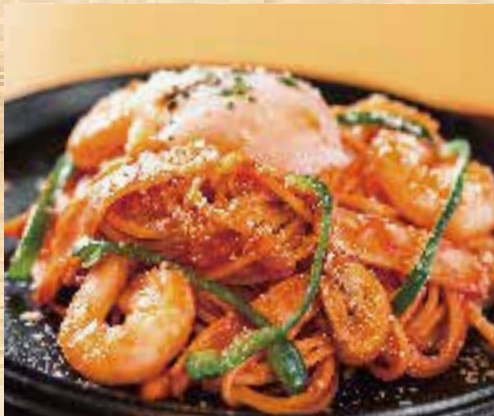
昔ながらの下町ナポリタン

甘みを引き出すようにじっくり炒めた新玉ねぎを、特製だれで仕上げたビフテキ丼。牛肉の旨みと玉ねぎのやさしい甘みが調和した、食べ応えのある一品です。香味野菜を添え、後味さっぱりとお楽しみいただけます。