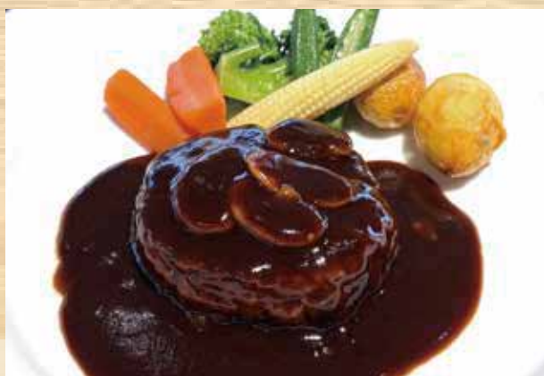
ハンバーグステーキ デミグラスソース ¥2,400 (パンまたはライス)

Hamburg steak with demi-glace sauce ( With Bread or Rice )