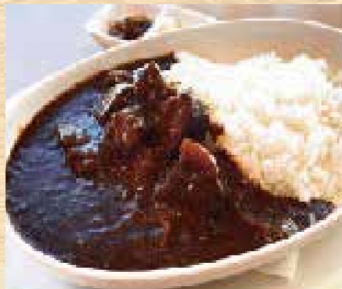
ニューオータニ特製 ビーフカレー ¥1,700