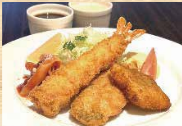
シーフードフライ盛り合わせ ¥2,500 (パンまたはライス)

ジューシーなハンバーグに、コク深いデミグラスソースが絡む絶品の洋食。付け合わせとともに楽しめる満足感のある一品。