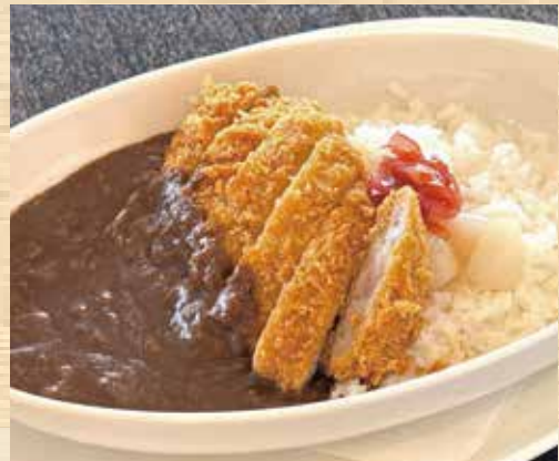
三元豚のカツカレー

下町の王道のナポリタンが美味しく進化しました！とろける温泉玉子を添えて熱々の鉄板でサービスします。