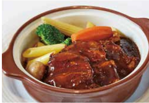
ビーフシチュー温野菜添え (パンまたはライス) ¥2,600

ジューシーなハンバーグにじっくり煮込んで ビーフシチューを添えた贅沢な一品です。