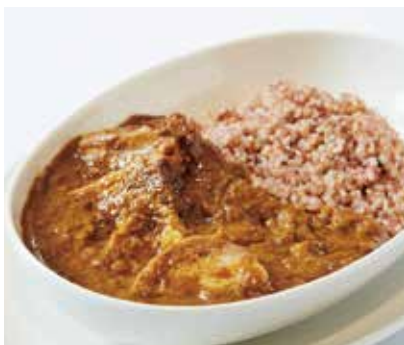
Jシリアルビーフカレー ¥1,700

柔らかく煮込んだ牛肉とJシリアルと一緒に シェフ特製のスパイシーなカレーソースで お召し上がりください。