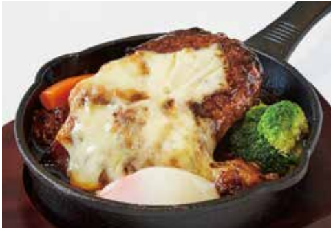
煮込みチーズハンバーグ (パンまたはライス) ¥2,400

ジューシーなハンバーグにじっくり煮込んで ビーフシチューを添えた贅沢な一品です。