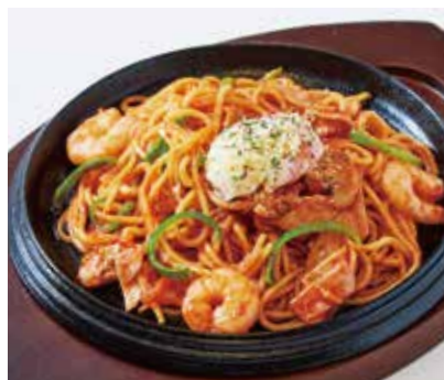
昔ながらの下町ナポリタン 鉄板焼き 温玉子添え ¥1,700

柔らかく煮込んだ牛肉とJシリアルと一緒に シェフ特製のスパイシーなカレーソースで お召し上がりください。