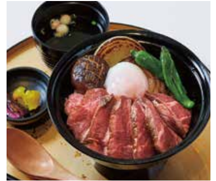
ビフテキ丼 (味噌汁・香の物付き) ¥2,900

Jシリアルを使用したバジル風味の バターライスの上に、カニと海老をふんだんに あしらった贅沢熱々ドリア。