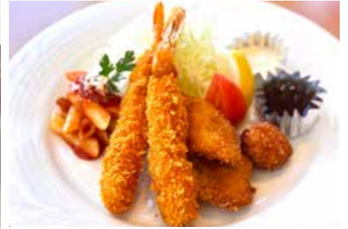
シーフードミックスフライ (パンまたはライス) ¥1,900

ニューオータニの伝統を引き継ぐソースで牛肉を ポルドーワインでじっくり煮込んだ口の中であとろけるシチューです。