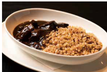
"Jシリアル" ビーフカレー