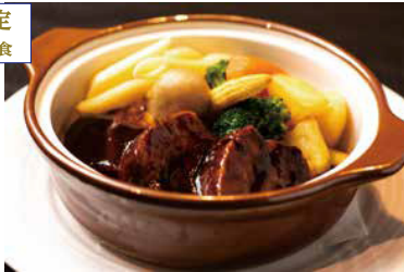
ビーフシチュー 温野菜添え