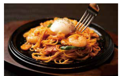
昔ながらのナポリタン鉄板焼き 温泉玉子添え

ジューシーでソフトな食感に仕上げたさっくりメンチカツと、バターとの相性が抜群に良い真鱈のムニエルが食欲をそそる一品です。