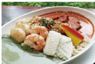
レッド&グリーン2色カレー