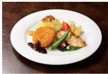
メンチカツ&真鱈のムニエル バター醤油ソース

Jシリアル (*1を使用したバジル風味のバターライスの上に、カニと海老をふんだんにあしらった贅沢熱々ドリア。