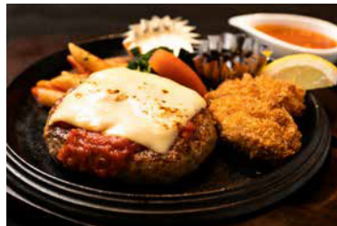
ハンバーグ&カキフライ

ニューオータニ伝統を引き継ぐソースでアメリカ産牛肉をホルダーワインでじっくりと煮込んだ口の中ですとろけるシチューです。